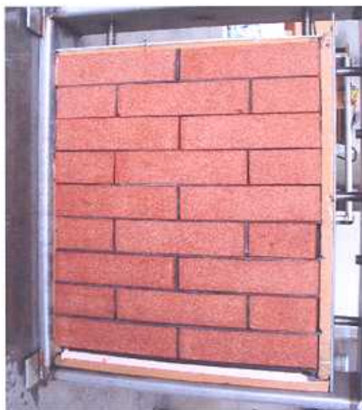
Figura 2: Pannello sottoposto a prova